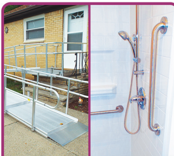
MODIFICACIONES EN EL HOGAR