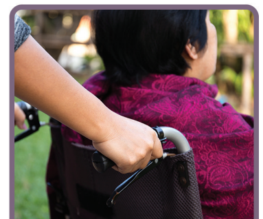
CUIDO DE RESPIRO