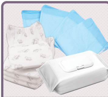
ARTÍCULOS DE INCONTINENCIA