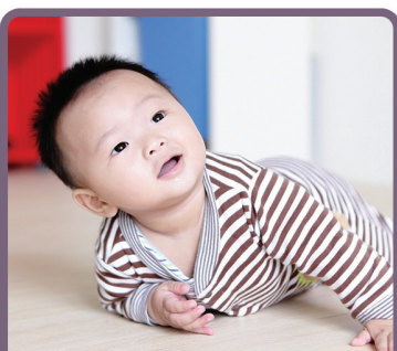
SERVICIOS PARA INFANTES/ NIÑOS PEQUEÑOS